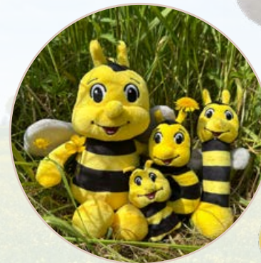
6563 rPET BIENE BIENCHEN Eine Botschafterin für den Umweltschutz. Ihr weiches Plüsch ist aus recyceltem Polyester. Mit ihrem sonnigen Lächeln und der Stupsnase ist sie einfach zum Knuddeln.

VE 100 Stück Artikelmaße: ca. 22 x 10cm Farbe: schwarz/gelb Material: recyceltes PET Plüsch Druckstand: auf dem Label Druckfläche: 50 x 10mm