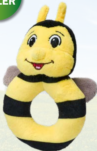
6593 rPET BABY GREIFFRING BIENCHEN strahlt sonnige Fröhlichkeit aus und regt zum Spielen an. Die Form und das weiche Kurzhaar- plüsch eignen sich besonders gut für Babies. Artikelmaße: ca. 15 x 9cm

VE 300 Stück Farbe: schwarz/gelb Material: recyceltes PET Plüsch Druckstand: auf dem Label Druckfläche: 50 x 10mm