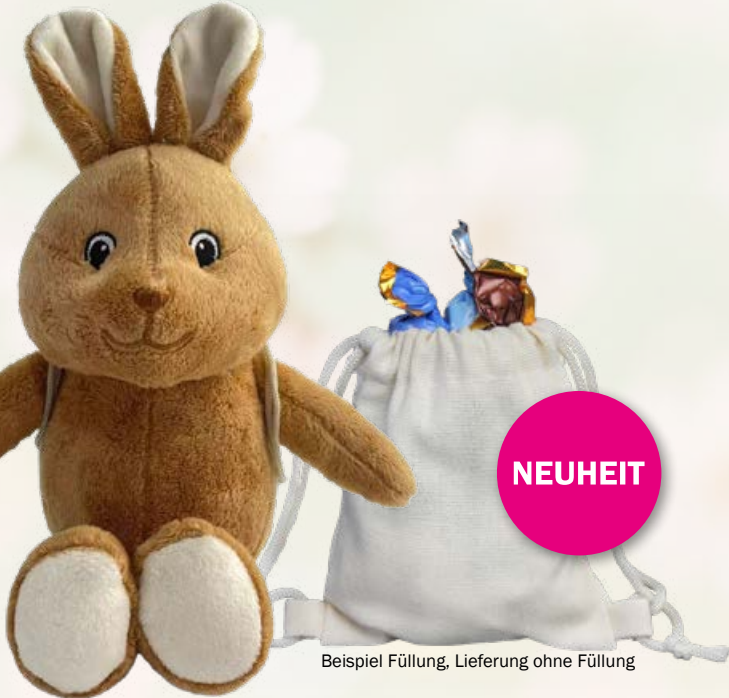
Beispiel Füllung, Lieferung ohne Füllung