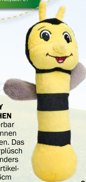
6592 rPET BABY RASSEL BIENCHEN lässt sich wunderbar greifen und hat innen drin ein Glöckchen. Das weiche Kurzhaarplüsch eignet sich besonders gut für Babies. Artikel- maße: ca. 18 x 6cm