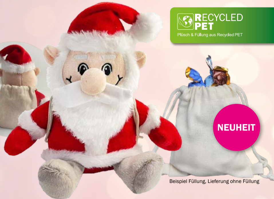
Beispiel Füllung, Lieferung ohne Füllung